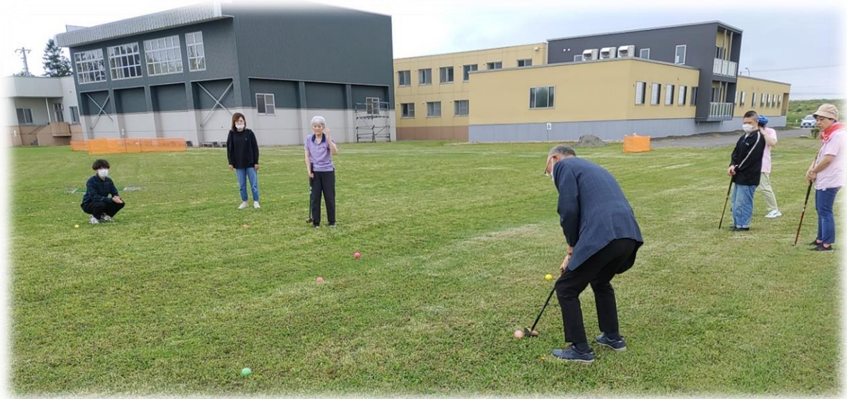
2024年6月 えべつ幸誠会パークゴルフ場 OPEN